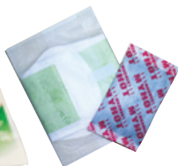
左がナプキン、右がカイロ